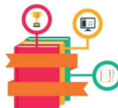
Стажировки в сети «Школа Росатома»

Цель: сохранение единства семей работников атомной отрасли и подрастающего поколения в регионах присутствия. Росатом, открывая учебные заведения и филиалы вузов в городах присутствия организаций (филиал МГУ им. Ломоносова в Сарове, филиалы НИЯУ МИФИ в ЗАТО (Саров, Снежинск)), «приближает» возможность получения образования в регионах проживания молодежи.