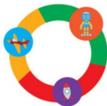
Сеть детских садов