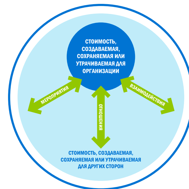
Рисунок 1. Стоимость, создаваемая, сохраняемая или утрачиваемая для организации и для других сторон

учитывается степень, в которой эффекты на капиталы являются внешними по отношению к организации (т.е. в форме затрат или иного влияния на капиталы, не принадлежащие организации).